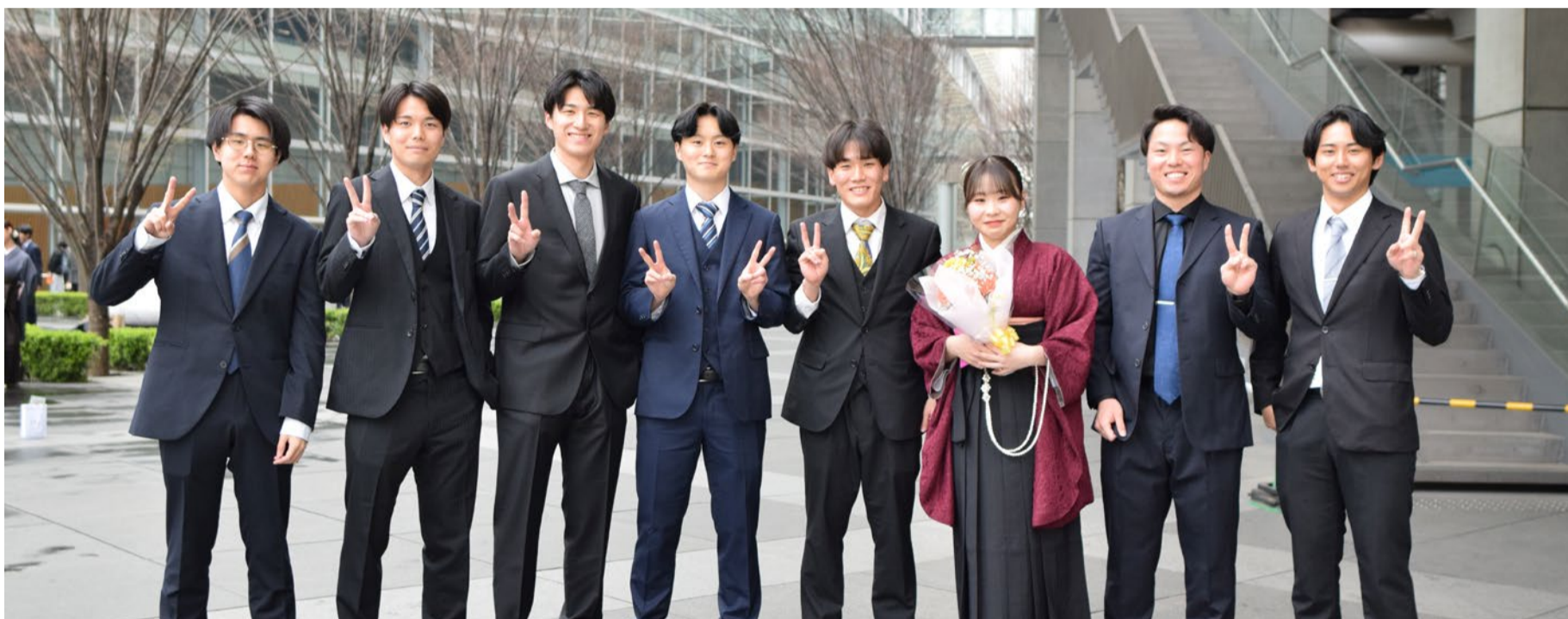
それぞれの夢を胸に、2,427人が新たな未来へ歩み出す