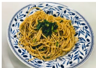
ふりかけとパスタを組み合わせた「ゆかりパスタ」

集まった食品を活用したレシピ開発にも学生が挑戦した。食品リストを調査し、家庭で使い切れず残りがちな食材を有効活用するメニューを検討。健康面にも配慮しながら、実際に調理まで行った。蕪木智子教授(健康科学科)もサポートを担当し、食材の組み合わせや調理