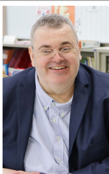
ダレン・マクドナルド教授

ダレン教授: 問題解決能力を鍛えるためには、授業の主体はあくまでも学生でなければならないと考えています。そのため、「私が学生に教える」のではなく、「学生が自ら立てた