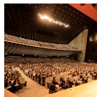
学位記授与式の様子

ように温かいチームと多くの声援、恵まれた環境に支えられ、日本一に挑み続けることができた。部活動と並行した社会学部での学びは発見の連続であり、社会を構築から見つめ直す姿勢が養われた。対話の積み重ねが社会を形づくり、自分自身と向き合う力につながるのだと学んだ」と大学で得た成長を述べ、未来へ歩み出した。