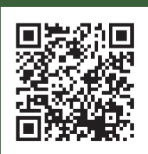
大東文化歴史資料館 企画展についてはこちら