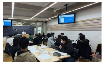
春からの新入生が板橋キャンパスに集結

受付では在学生スタッフが笑顔で迎え、緊張気味の高校生を丁寧にサポートした。イベントはアイスブレイクから始まり「好きなものインタビュー」と題したグループワークへと進行。続いて、在学生による大学生活紹介が行われた。授業の様子、課外活動の雰囲気、アルバイトとの両立など、実体験に基づく具体的なエピソードが語られ、参加者は熱心に耳を