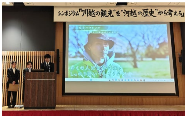
学生ガイドによる研究報告を実施