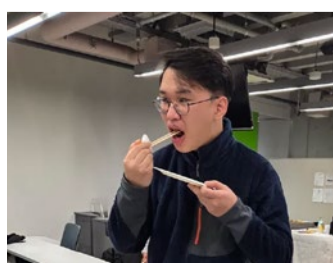
食を通じて食品ロスの重要性を学ぶ

調理実習では、普段交流の少ない学生同士が協力しながら作業を進め、食を通じた自然なコミュニケーションが生まれたという。また、食材の特徴や栄養について学びながら調理することで、食品ロス問題を自分ごととし