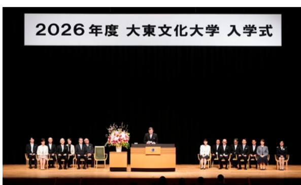
東京国際フォーラムでは2度目の入学式

2026年度入学式が4月7日、東京都千代田区有楽町の東京国際フォーラム・ホールAで挙