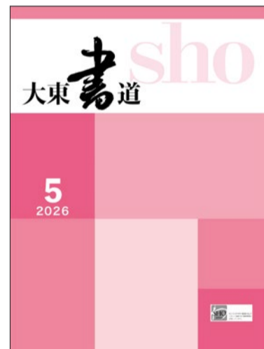
月刊「大東書道」毎月刊行中