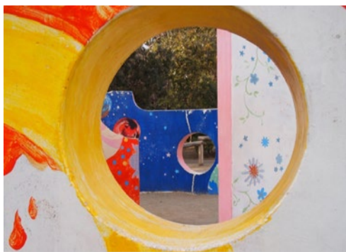
春陽の公園にて(埼玉県桶川市)

創作への気分が動き始めたとき、私にとって大事な場所は、喫茶店と公園のベンチである。そこでの読書やノートの時間、あるいは放心のひと時、記憶とも夢想とも感じられるねっとりした思念が、一つの物語のように誘い出されることがあるからだ。